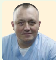
Dr. Andrei FILIP

Ochii cu dioptrii extreme, în funcție de tipul dioptriilor, pot fi predispuși către anumite afecțiuni. Spre exemplu, miopia pot suferi diverse afecțiuni retiniene pe toată durata vieții - după 40 de ani au șanse mari